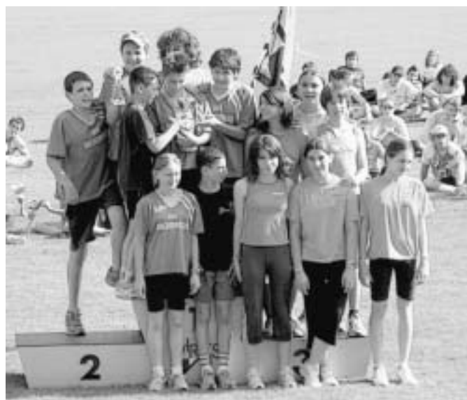
La squadra dei CSI di società

sempre ad avere ragazzi o ragazze particolarmente dotati e che sanno distinguersi a livello cantonale e quest'anno anche svizzero.