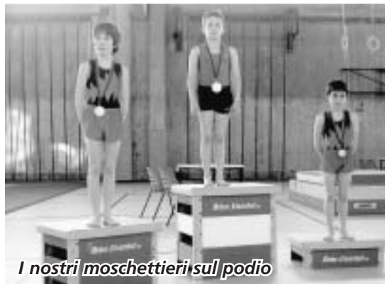
I nostri moschettieri sul podio