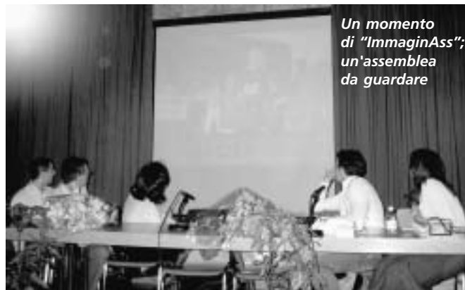
Un momento di "ImmaginAss"; un'assemblea da guardare

Un'assemblea particolare "ImmaginAss", certamente perfetta ma che è piaciuta ai soci e che potrà quindi essere ripetuta nella convinzione di poter stimolare un maggior coinvolgimento di tutti gli amici che compongono la società ginnastica di Mendrisio.